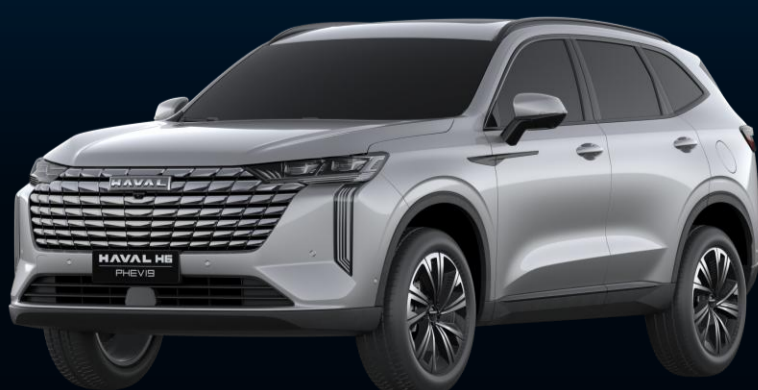
CINZA DIAMANTE (METÁLICA)