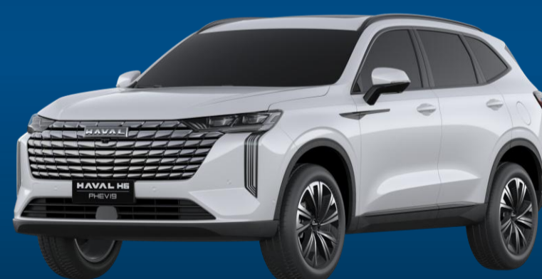
BRANCO ÁGATA (PEROLIZADO)