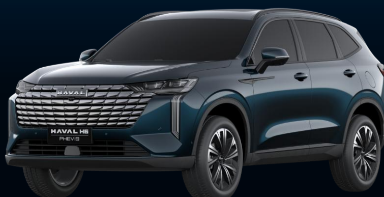
AZUL CIANITA (METÁLICA)