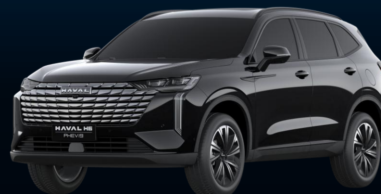
PRETO HEMATITA (METÁLICA)