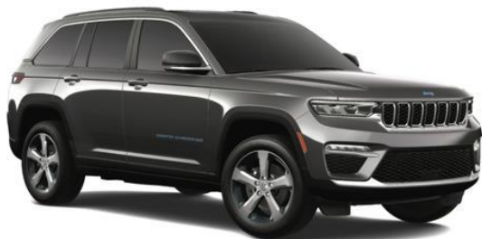
BALTIC GREY METALLIC