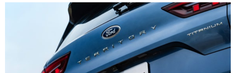
Porta malas elétrico