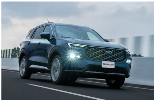
Piloto automático adaptativo com Stop and Go