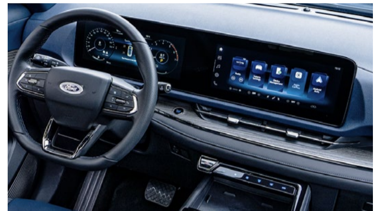
Central multimídia e painel 12.3" polegadas