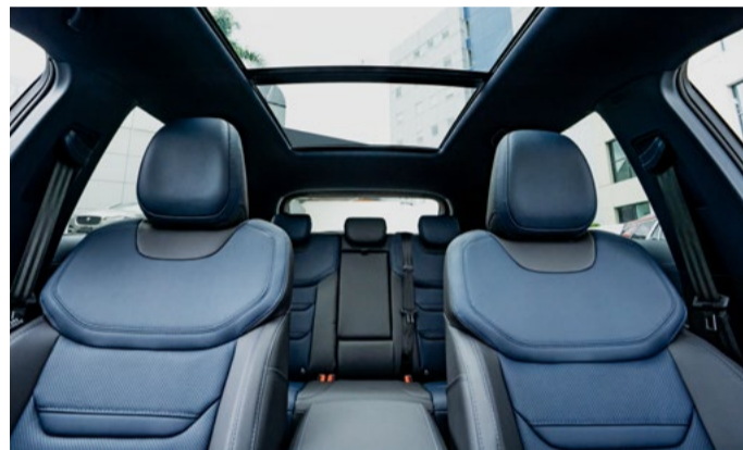
Teto solar panorâmico